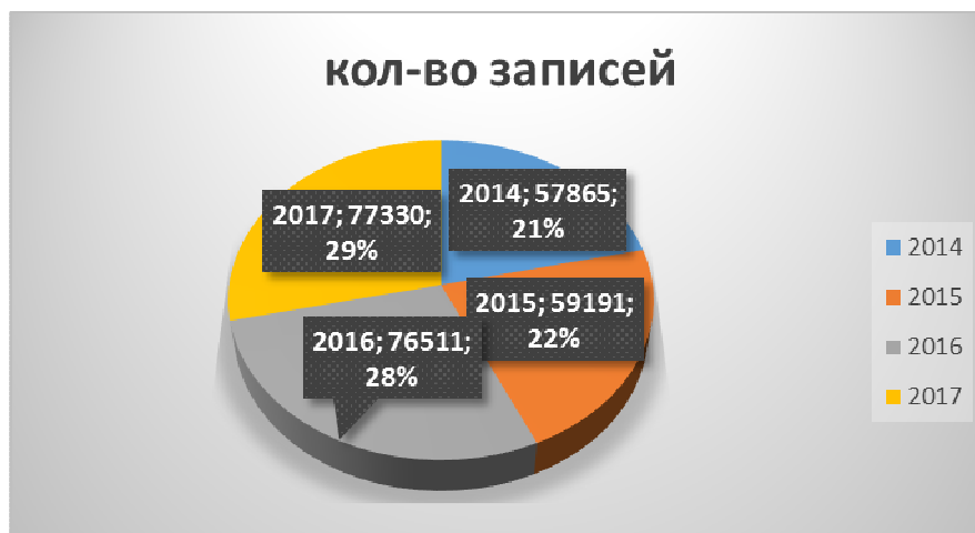
Движение электронного каталога